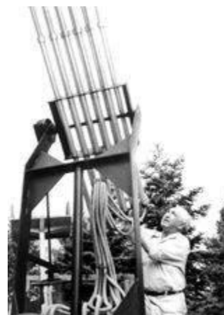
Figura 3. El “cloudbuster”, diseñado para hacer llover condensando la energía orgone de la atmósfera.

Se atribuye al generalísimo Máximo Gómez aquella famosa frase de que “los cubanos siempre se pasan o se quedan cortos”. En lo de otorgar apellidos a energías inexistentes, sin lugar a dudas nos hemos pasado ampliamente.