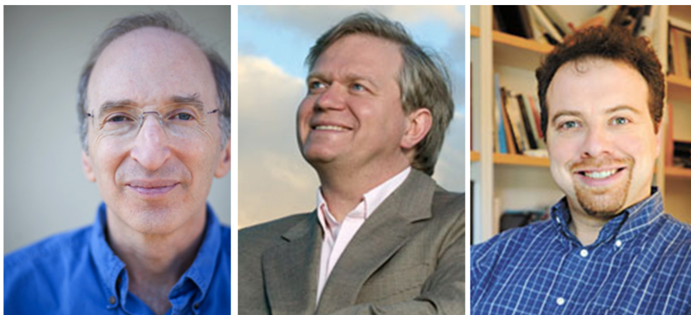
Figura 2. Premios Nobel de Física 2011. De izquierda a derecha, Saul Perlmutter, Brian P. Schmidt y Adam G. Riess

Las razones para este otorgamiento tienen sus raíces en un hallazgo publicado en 1998, y que provocó una sacudida en la cosmología por los descubrimientos realizados por los dos grupos de investigación. El primero de éstos, liderado por Saul Perlmutter, comenzó en 1988. Brian Schmidt encabezó el otro grupo, fundado a fines de 1994, y en el cual Adam Riess fue una figura muy destacada. Ambos grupos competían en hacer un mapa del Universo, ubicando las supernovas más distantes, y usaron un tipo particular de supernova, llamado supernova de tipo Ia ,