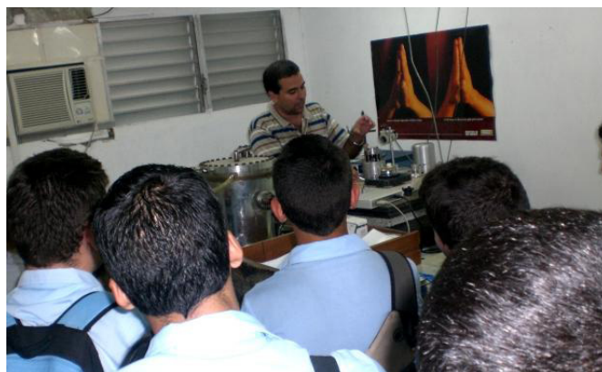
Fig. 2 De primera mano. Durante una visita al Instituto de Ciencia y Tecnología de Materiales (IMRE), estudiantes que cursan el duodécimo grado en la Universidad de La Habana para ingresar en la especialidad de Física, reciben una explicación sobre el funcionamiento del primer Microscopio de Efecto Túnel fabricado en nuestro país.

Seminario Investigativo 2 “Historia de la Física y su contribución al desarrollo de la humanidad” Se orientó al comenzar el 2 do semestre y se expuso al finalizar el curso. Para este seminario los grupos se dividieron en 8 equipos de estudiantes cada uno, con temas que iban desde la Física en la antigüedad hasta la Física de los días actuales y donde se valorara a la ciencia como empresa colectiva y se fundamentara la importancia de la Física para el desarrollo de otras ciencias, de la técnica y de la sociedad, se demostrara que la historia de una ciencia está estrechamente ligada a las personas que la desarrollaron, sus cualidades, esfuerzos y sacrificios, y a las condiciones sociales del país y la época histórica que les correspondieron, y se enfatizara en comprender el método científico de investigación al mostrar la mutabilidad de los conocimientos científicos a lo largo de la historia.