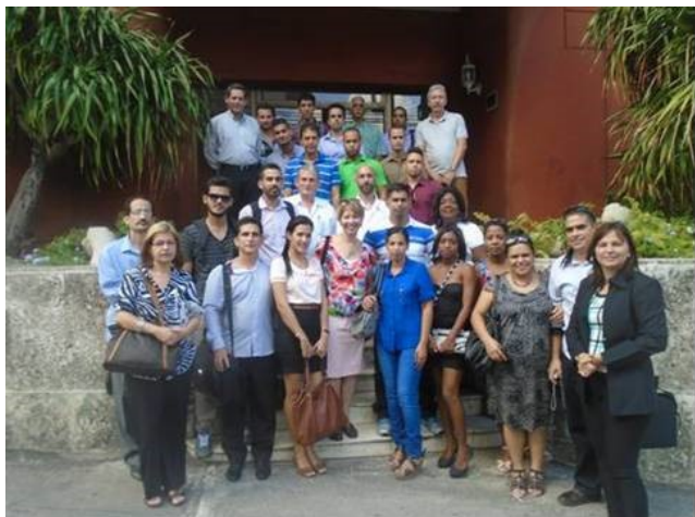
Celebrando el Día Internacional de la Física Médica. Foto de grupo de los participantes en la celebración, el 7 de noviembre de 2015, a la salida del “El Cortijo” (Hotel Vedado, La Habana).

Con una Jornada Científica realizada en el salón “El Cortijo” del Hotel Vedado fue celebrado el Día Internacional de la Física Médica el 7 de noviembre de 2015. La Jornada Conmemorativa “Física médica realidades y perspectivas” fue organizada por la Sociedad de Física Médica (sección de física médica de la Sociedad Cubana de Física), apoyado por la Organización Panamericana de la Salud (OPS), el Hospital Clínico Quirúrgico “Hermanos Ameijeiras” y Tema Sinergie. Contó con la presencia de 41 especialistas nacionales que expusieron los resultados de los trabajos científicos presentados este año en eventos nacionales e internacionales a propósito de las nuevas tecnologías, y la importancia de la física médica en su desarrollo.