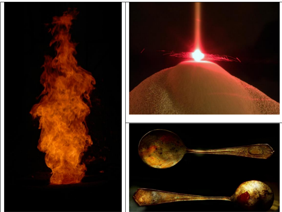
Vislumbrando el entorno visual y natural. A la izquierda: El principio (primer lugar). A la derecha, arriba: Luz sobre las tres fases (segundo lugar). A la derecha, abajo: Anverso y Reverso (tercer lugar).