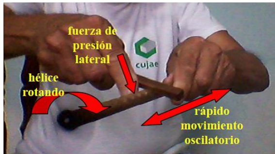
Figura 2. El profesor hace girar la hélice.

Al friccionar la varilla sobre el cuerpo de la hélice ( F_1 ), se produce un movimiento oscilatorio influenciado por la periodicidad de las ranuras. Si con la mano que mueve la varilla se ejerce una fuerza ( F_2 ) en uno de los bordes del cuerpo, se introduce una componente oscilante de fase diferente en otra dirección, lo que origina un movimiento rotatorio del eje de la hélice. En dependencia del sentido en que se aplique el dedo, la hélice girará en un sentido u otro.