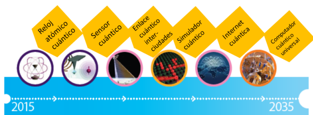
Figura 1. Línea hipotética del tiempo de las tecnologías cuánticas

y sensores cuánticos para usos biomédicos incrementando en varios órdenes de magnitud la sensibilidad, la resolución y exactitud de las mediciones (en particular de las multiplicidades de imágenes biomédicas), como se ilustra en la Figura 1. Surgen nuevos métodos de modelación y simulación cuántica, de generación y transmisión de la energía, materiales con nuevas y sorprendentes características, entre otros elementos [4]. Estas otras revoluciones plantean nuevos desafíos a la enseñanza de la Física desde el punto de vista de la formación teórica y experimental; ambas deterioradas a grados preocupantes en nuestro país. Nos enfrentamos a una nueva visión de la interrelación de las Ciencias Básicas con las tecnologías y las ingenierías. Nos enfrentamos también a la visión clásica de las tecnologías en conjunción con aquellas nuevas visiones y paradigmas con enfoques cuánticos, moleculares, niveles micro, nano y sub nanométricos. Nos enfrentamos al reto de crear motivación hacia nuestra ciencia, en antagonismo al desenfrenado interés pragmático y simplista del mundo contemporáneo.